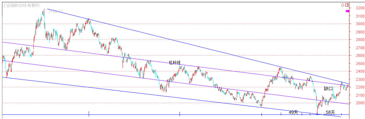
上证指数近期时间结构分析